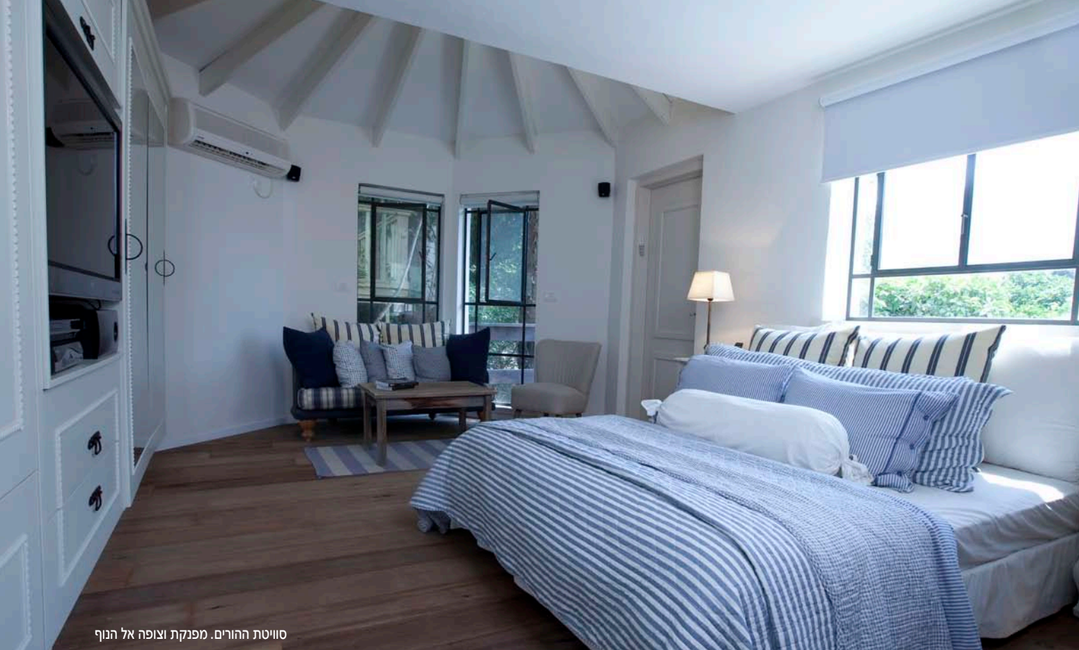
סוויטת ההורים. מפנקת וצופה אל הנוף

כל אחד מהחדרים סטים של מצעים המתאימים לגונו ובכך נשמרת הרמוניה בחלל. גם חדרי הרחצה כולם מבוססים על חיפויים זהים, עם אבן יריחו בגודל של 10/10. כל אזור בבית משקיף על מראה משובב נפש של החוץ: בקומת האירוח ישנם מפתחים נדיבים עשויים פרופיל ברזל בלגי, שדרכם ניתן ליהנות מרחבת אירוח מטופחת העשויה דק אורן ובה פינות חמד עמוסות צמחייה רעננה. ממרפסת חדר ההורים ניתן ליהנות מנוף הפרדס, מטע הפקאן וחלקה מעובדת של שדה חיטה, אשר מראהו משתנה בהתאם לעונה. במהלך החורף - שיבולים בצבע ירוק, לקראת האביב - השדה יזהיב, ובפתחו של הקיץ ניתן יהיה להתענג על מראה שדה חרוש עם חבילות חציר מאוגדות. גם הסוויטות הנוספות נהנות בנוף של צמחייה ירוקה, עצי פרי ומדשאות. ◀