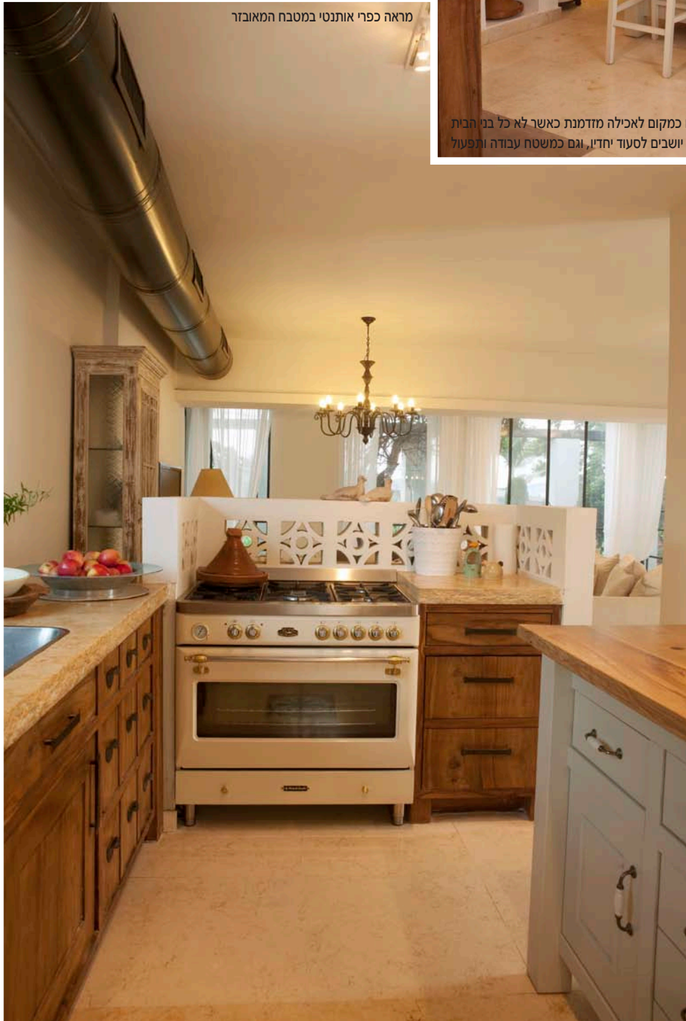
האי במטבח משמש גם כמקום לאכילה מזדמנת כאשר לא כל בני הבית יושבים לסעוד יחדיו, וגם כמשטח עבודה ותפעול